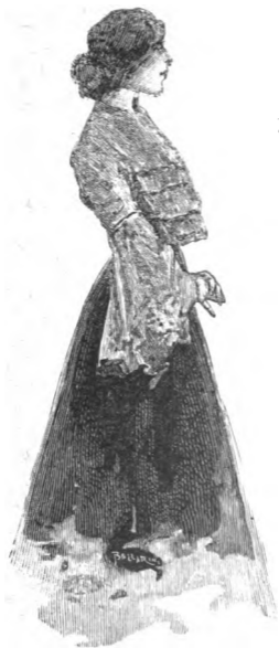
4 — Amori moderni.